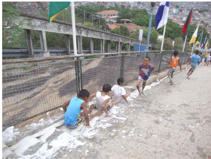
Figura 11: Subversão no Sagrado

Cabe chamar a atenção para a área intermediária entre o “em cima” e o “embaixo”, que seria a área da Irmandade, já dentro de seu limite murado, porém abaixo do santuário. Essa área “entre” materializa claramente a diluição dos limites, onde o profano invade o sagrado e vice-versa.